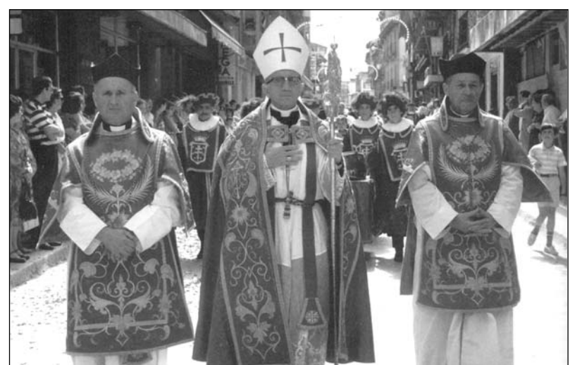
Procesión de Santa Orosia, 1986